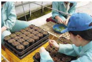
総合実習 (花壇苗の鉢上げ)