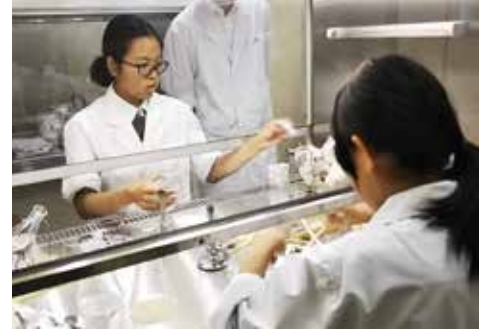
植物バイオテクノロジー