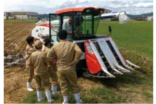
スマート農機研修