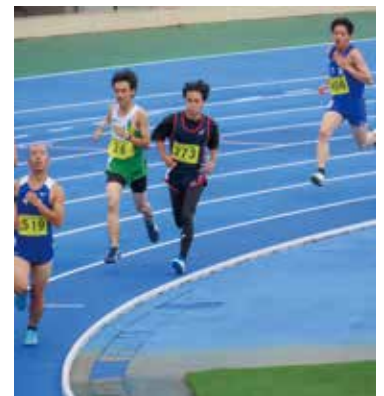
全国定時制通信制体育大会(陸上)