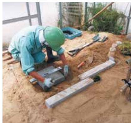
造園技能士検定練習