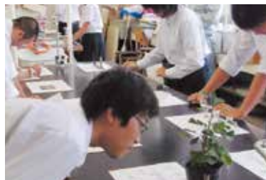
農業クラブ活動 (校内農業鑑定競技会)