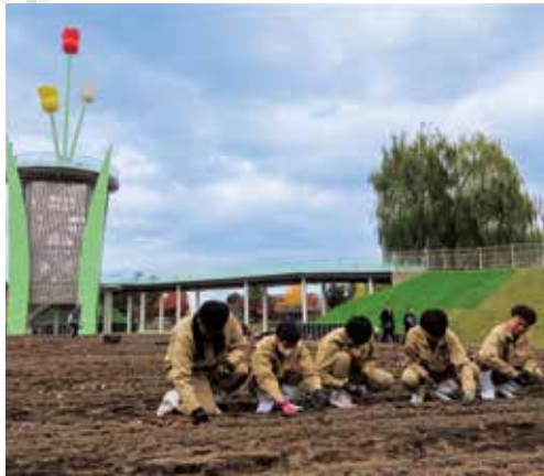
地域貢献活動 (チューリップ公園)