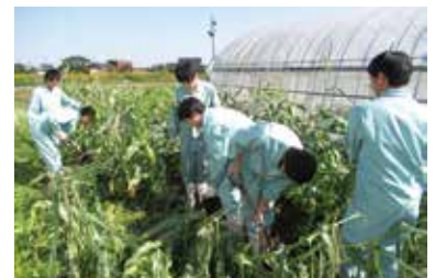
農業と環境 (トウモロコシの栽培)