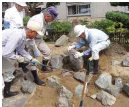
造園施工管理（造園系列）