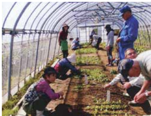
園芸栽培管理（園芸系列）